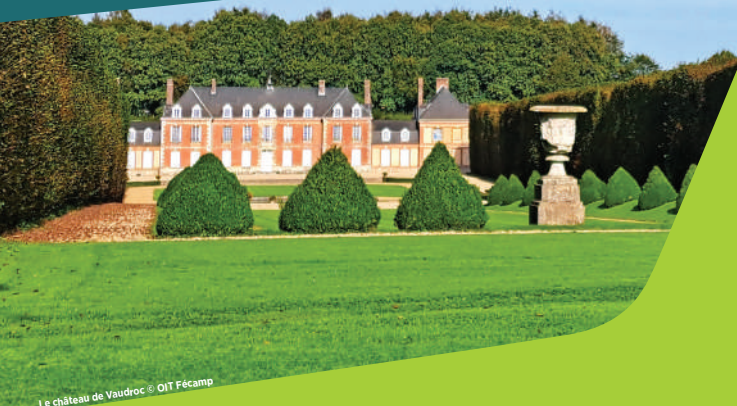
Le château de Vaudroc