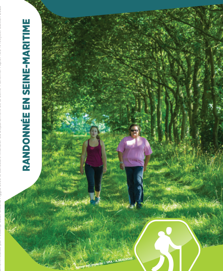
Autour de Limpville