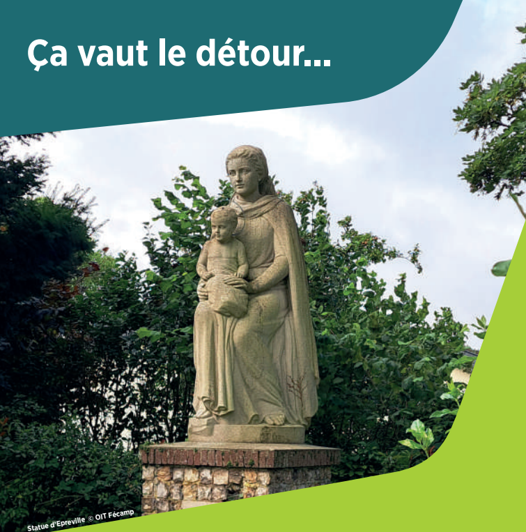
Statue d'Epreville