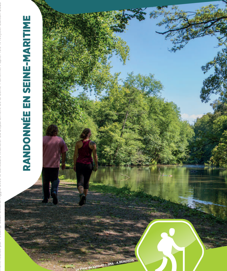
Le Vivier de Valmont

Document réalisé par Fécamp Caux Littoral Agglo avec le concours financier du Département de la Seine-Maritime. Papier 100 % recyclé. Édition 2023