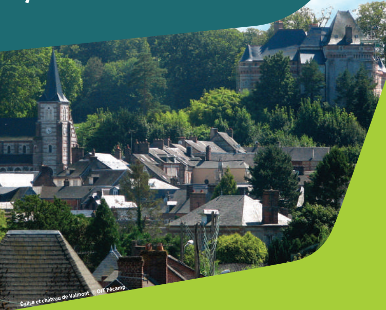
Église et château de Valmont