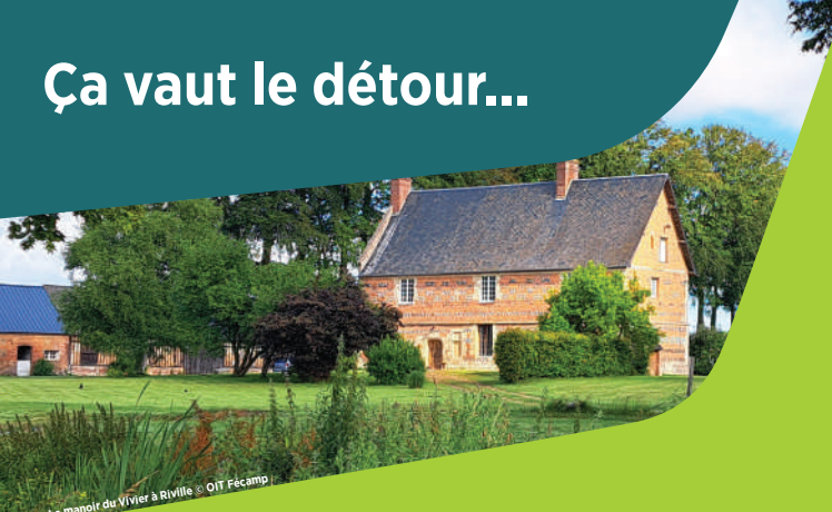
Le manoir du Vivier à Riville