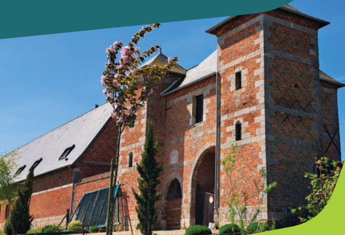
Porche monumental Les Grandes-Portes, Gerponville