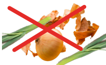
Épluchures pomme de terre, oignons et poireaux