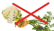
Céleris et choux