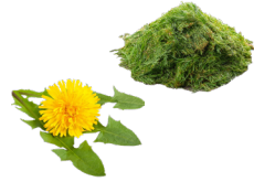
Tontes de pelouse fraîches (petites quantités) et mauvaises herbes (sauf : ortie, liseron, chardon...)