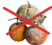
Pain et fruits moisissus