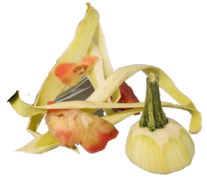
Épluchures de certains légumes