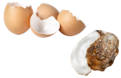
Coquilles d'œufs et d'huîtres broyées