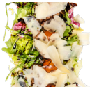
Restes de salade